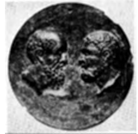
Petrus (regs) en Paulus op 'n Romeinse bronsmedalje uit die tweede eeu n.C. Uit Geschiedenis van de Kerk , red. Van Itterzon, J.H. Kok, N.V. Kampen, 1963.

Volgens voorstanders tree die gedagte van die "Frühkatholizismus" veral na vore waar die kerk tot 'n heilsinstituut ("Heilsanstalt") geword het. Hierdie ontwikkeling sou plaasgevind het ná die wegswaai vanaf die apostoliese kerk, waarvan reeds melding gemaak is. Gedurende hierdie fase word die apostoliese woord nie meer as enigste norm aanvaar nie. Die sakramente en die werking van die Gees